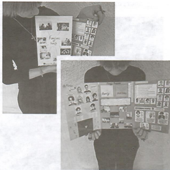
Рисунок 2 — Изготовленный лэпбук