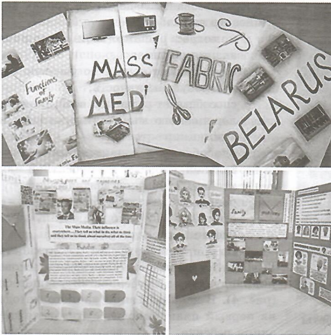
Рисунок 1 — Лэпбуки

подтемами. Педагог даёт рекомендации и контролирует качество выполненных заданий, чтобы вся подобранная информация соответствовала возрастным, эстетическим и этическим требованиям.