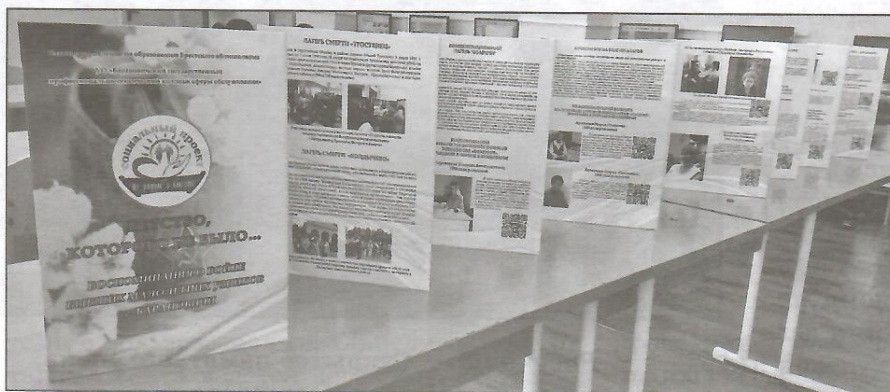
Рисунок 4 — Фрагмент книги «Детство, которого не было...»

Для сайта разработаны 3D-туры по музею; виртуальные экскурсии и динамические карты к памятным знакам Холокоста и местам геноцида в городе Барановичи и Барановичском районе; экскурсионные маршруты по улицам города, которые носят имена героев Великой Отечественной войны; военно-патриотический тур «Не дадим забыть».