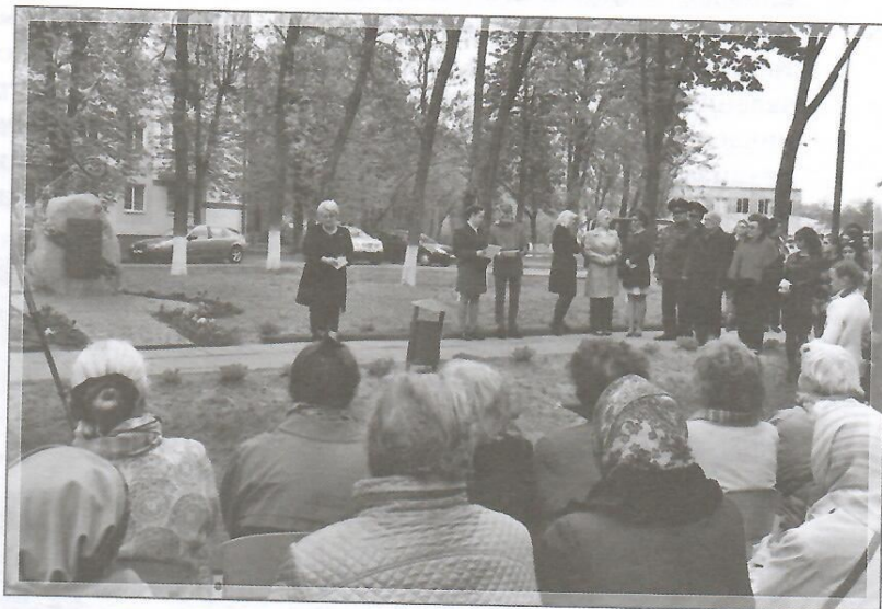
Рисунок 2 — Открытие памятного знака «Петля Нестерова»

Учащиеся колледжа оказывали волонтерскую помощь, проводили совместные занятия и мастер-классы с пожилыми