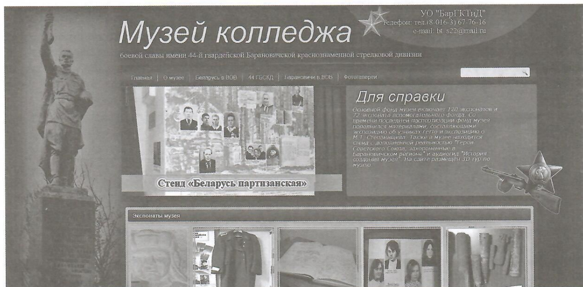
Рисунок 1 — Главная страница музея колледжа

эффективного использования информационных технологий. Важной задачей является и вовлечение аудитории через интерактивные элементы и качественный контент, поддерживающий патриотические ценности и историческую память.