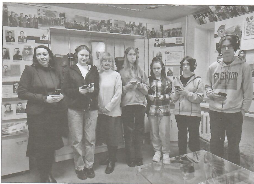
Рисунок 6 — Апробация экскурсии по музею с использованием аудиогuida

с обзорной экскурсией по музею (рис. 6). Также аудиогид дал возможность работать с экспонатами музея виртуально, в том числе через сайт.